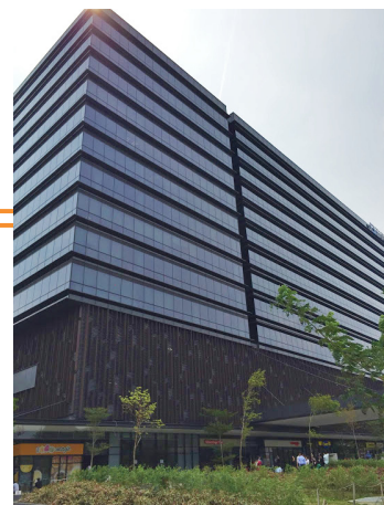
Paya Lebar Square 外観

参考 URL payalebarsquare : http://www.payalebarsquare.sg/