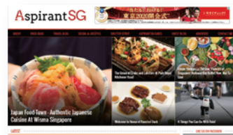
フードアンドトラベル